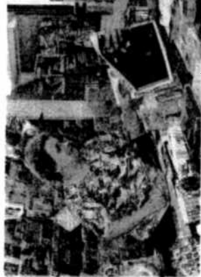
APPASSIONATA Renza Doda, gestisce da 15 anni l'omonima edicola in via Coti Zelati a Palazzo