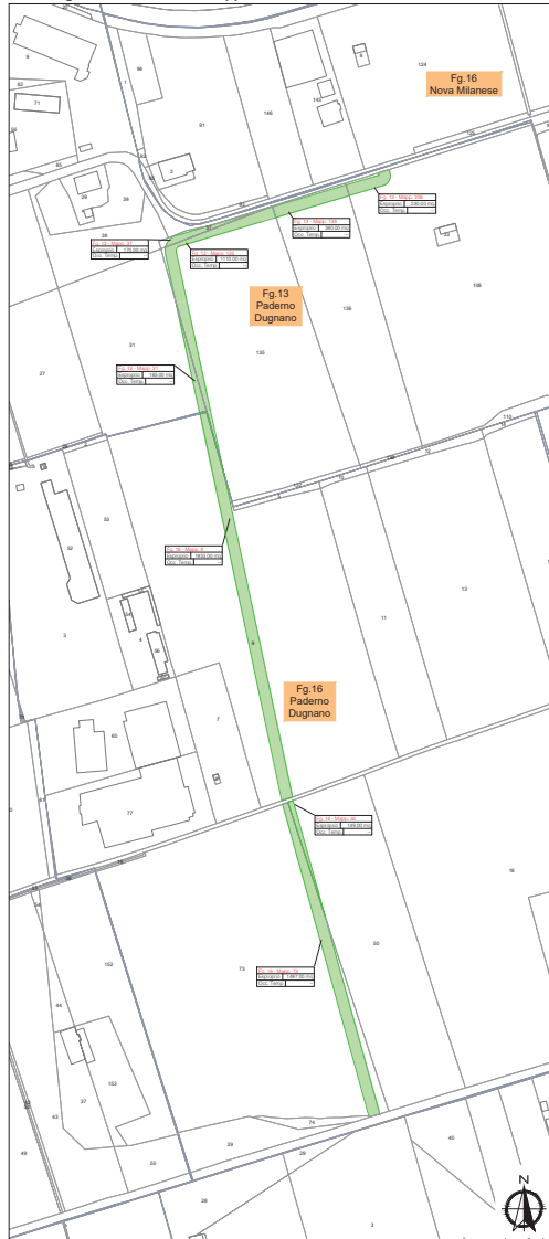
Area Lago Nord: Estratto di mappa catastale - scala 1:2000