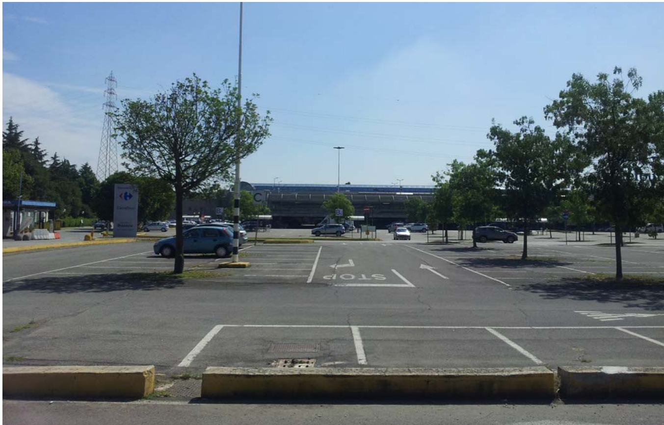
3. Vista del parcheggio a raso alberato