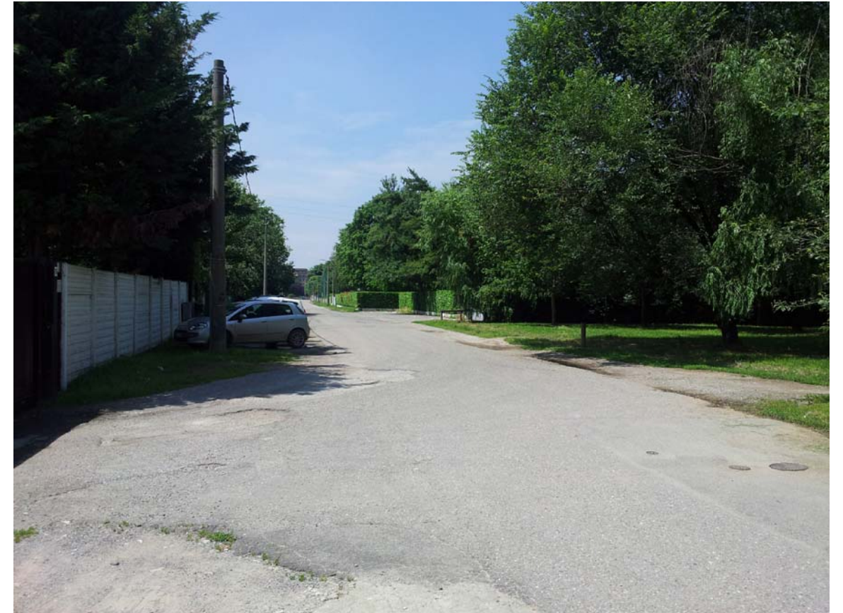
22. Vista di Via San Michele del Carso