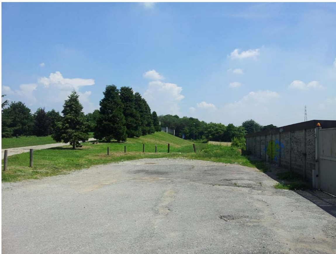
19. Porzione su terrapieno del percorso di connessione tra Parco Cava Nord e Via San Michele del Carso