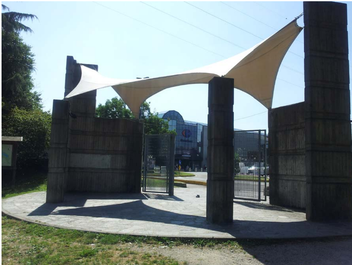
7. Accesso al Parco Cava Nord dalla viabilità interna del comparto