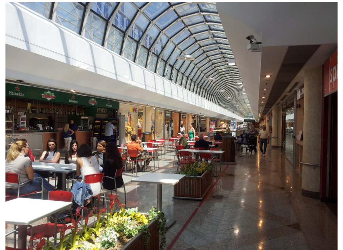
12. Vista interna della galleria commerciale al primo piano