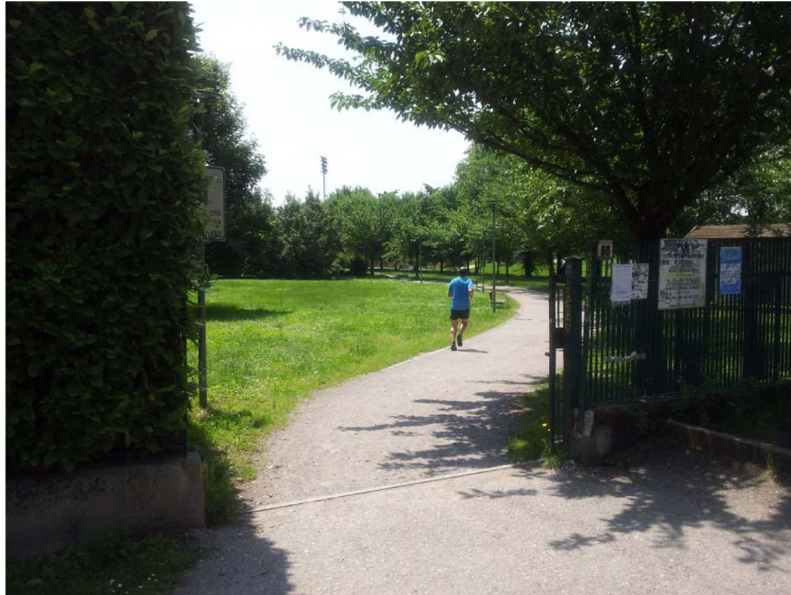
21. Accesso al parco pubblico su Via San Michele del Carso