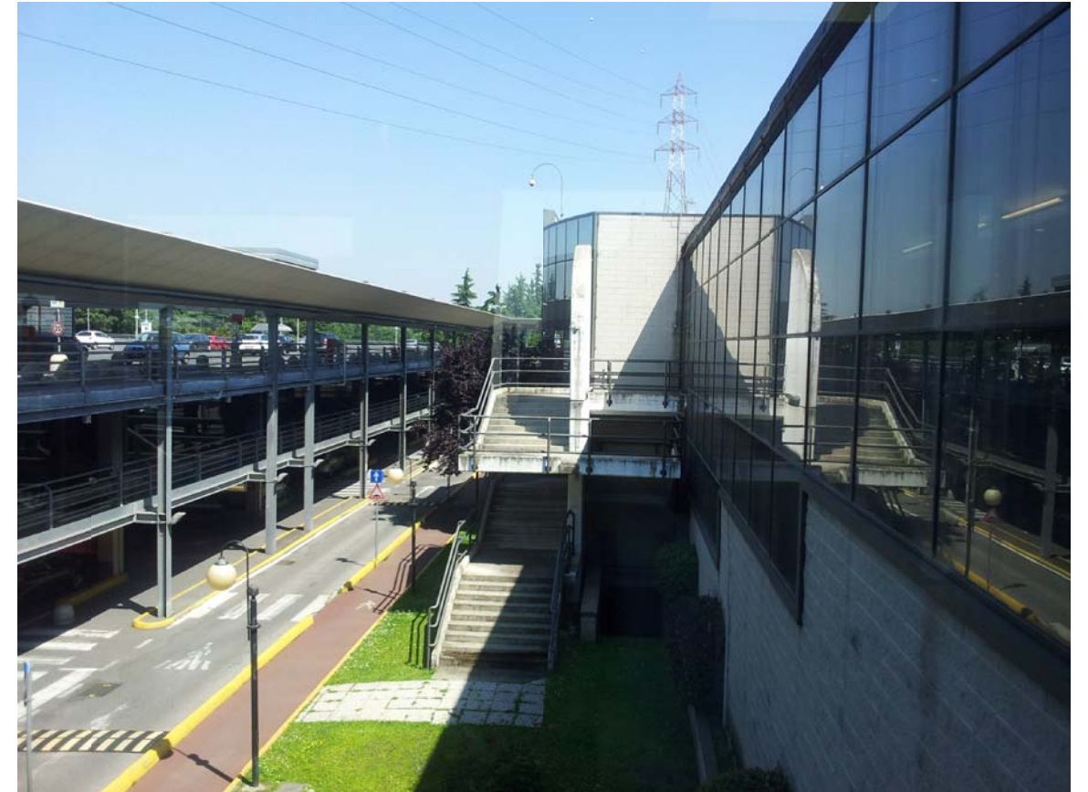
10. Vista della viabilità interna tra il fronte principale del Centro Commerciale e il silos con i collegamenti aerei alla galleria