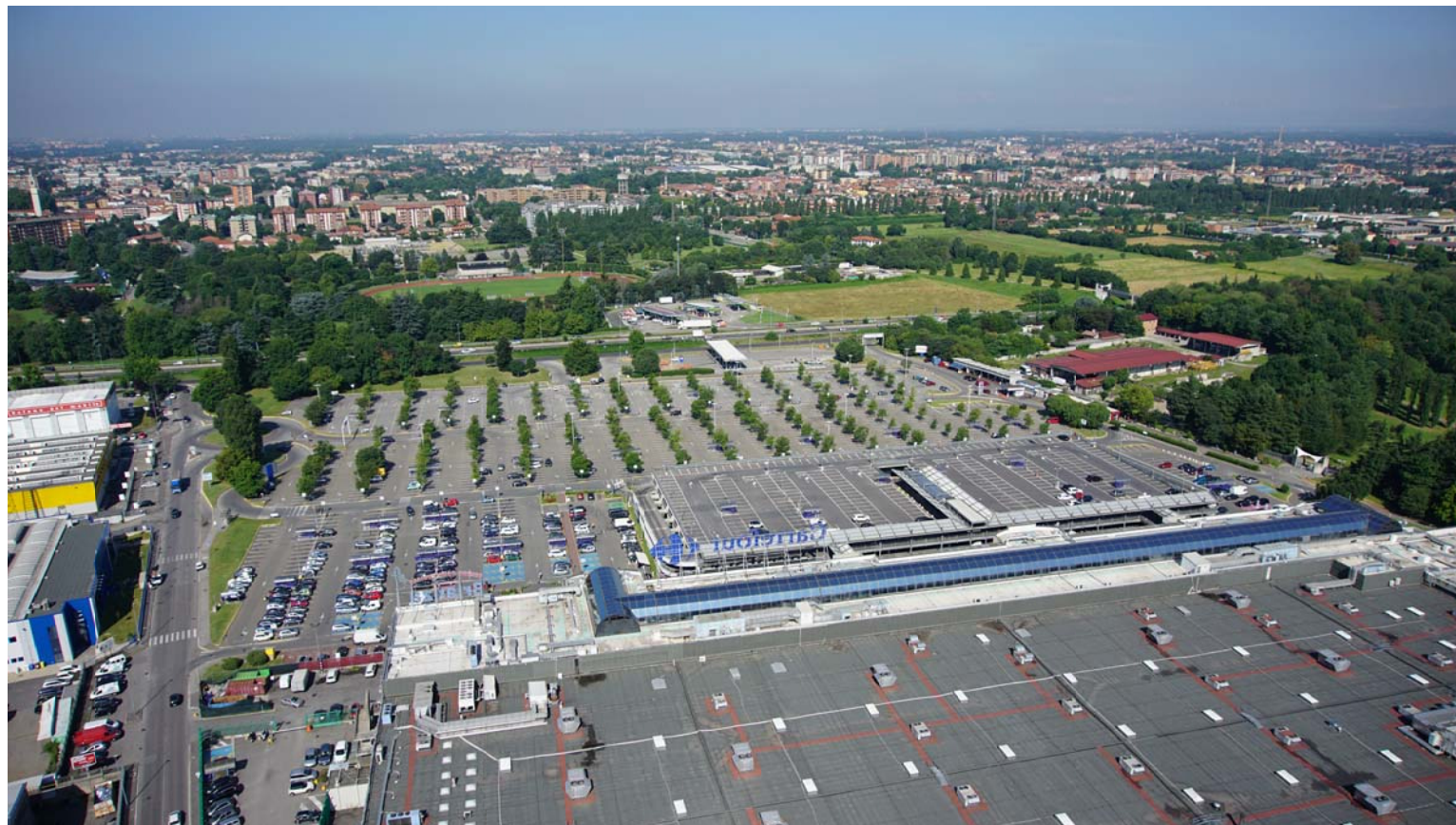
11. Vista aerea da est