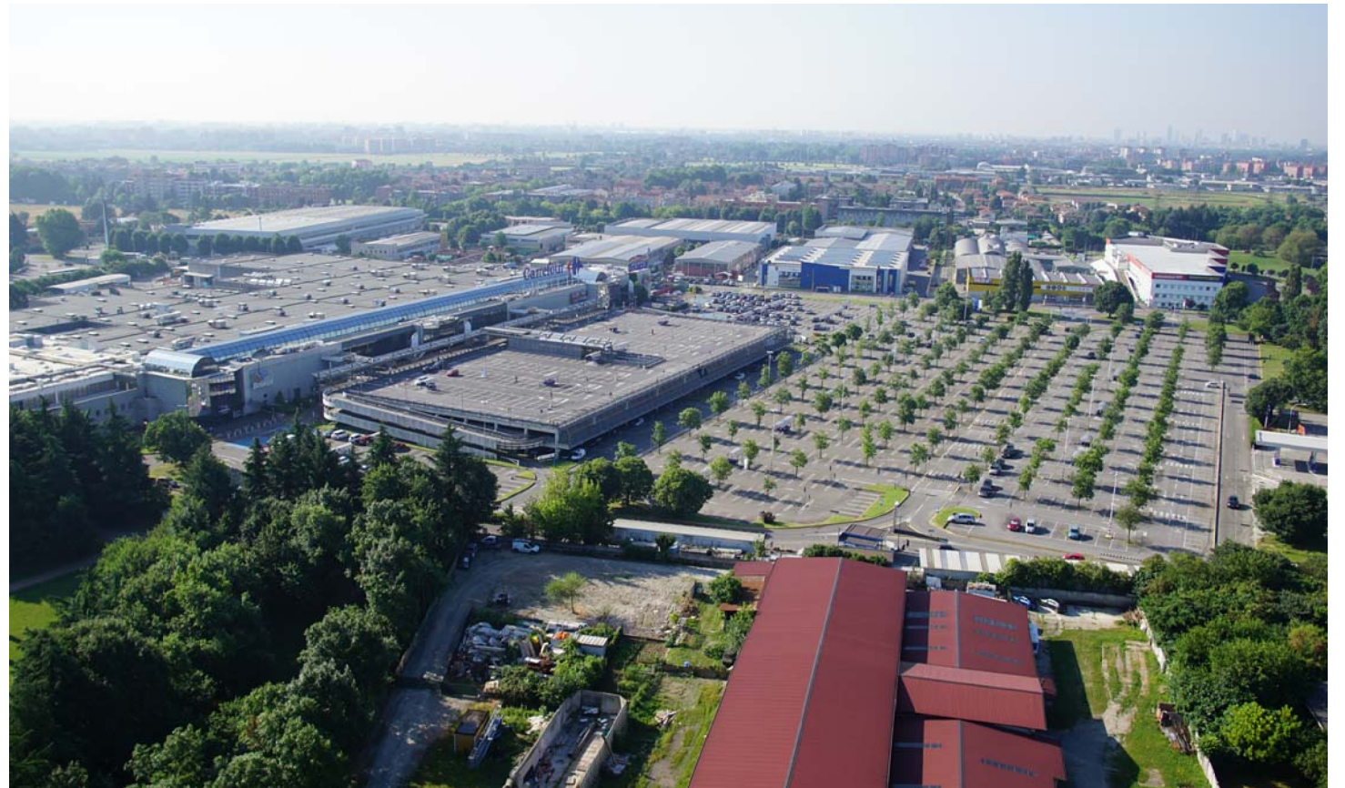
4. Vista aerea del Centro Commerciale "Brianza"