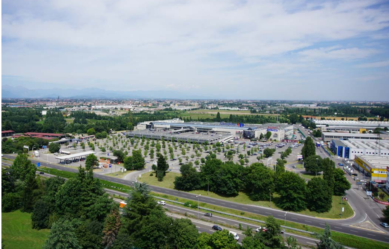
1. Vista aerea del fronte principale e degli spazi aperti del Centro Commerciale "Brianza"