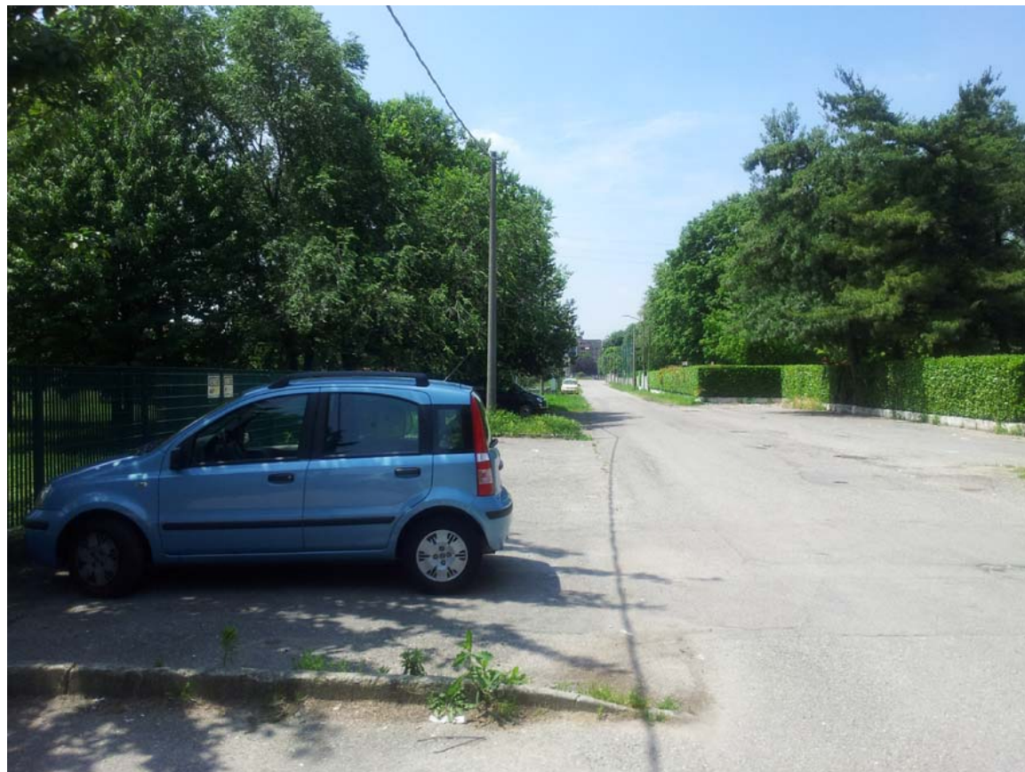
23. Vista di Via San Michele del Carso