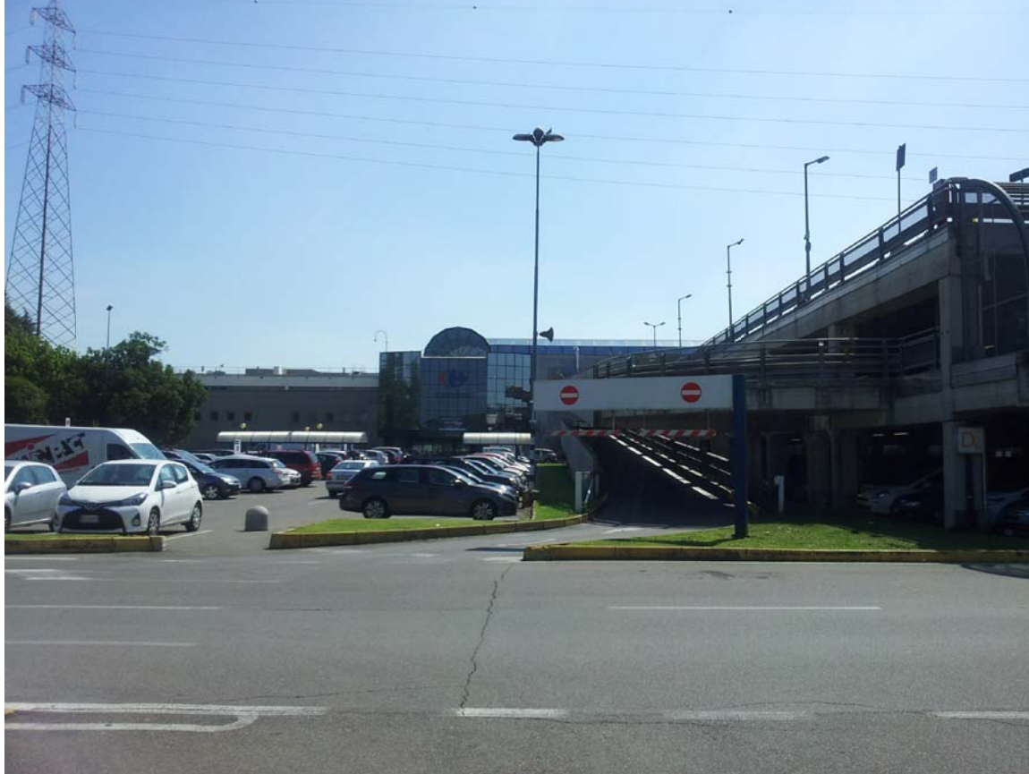
5. Dettaglio del sistema di rampe d'accesso al silos multipiano