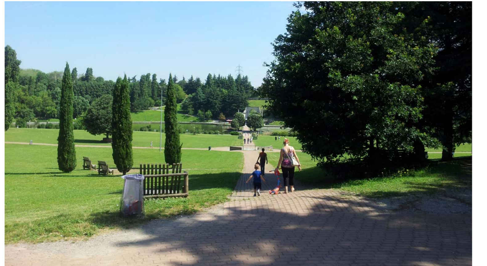
8. Vista del Parco Cava Nord dall'ingresso verso il laghetto