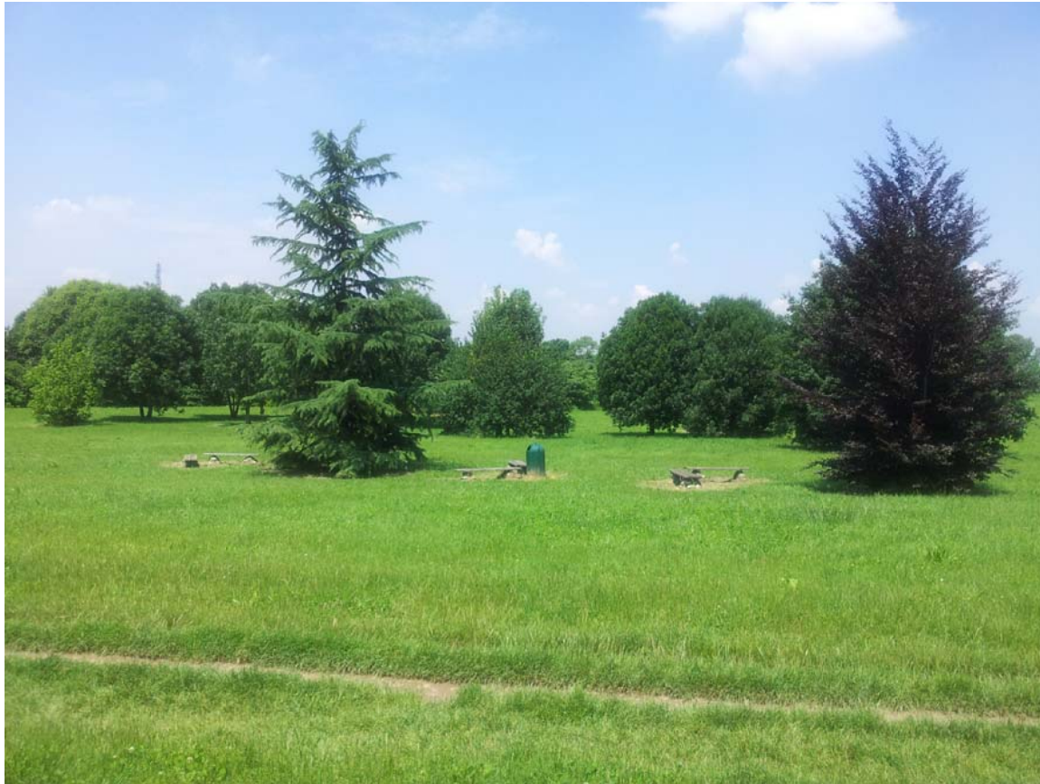
17. Area attrezzata per il tempo libero a est della Milano - Meda