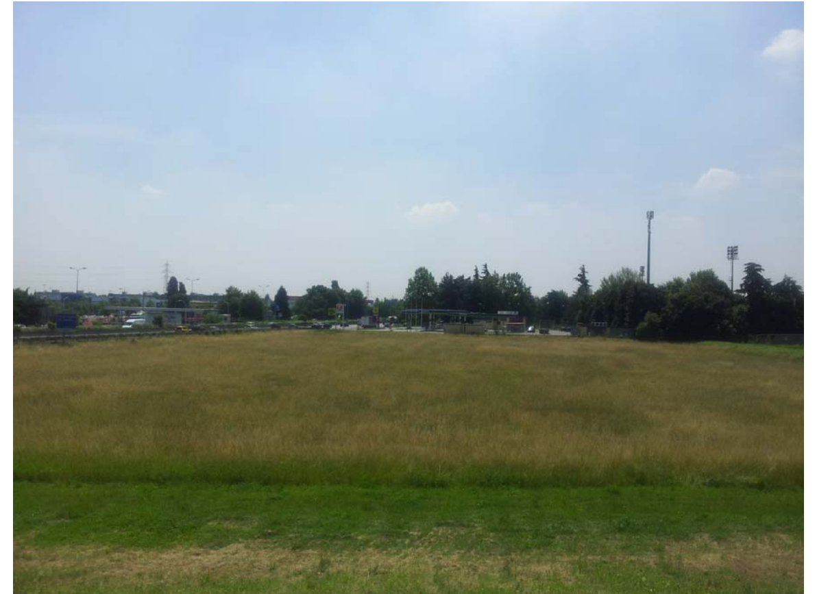
14. Area in cessione a ovest della Milano - Meda