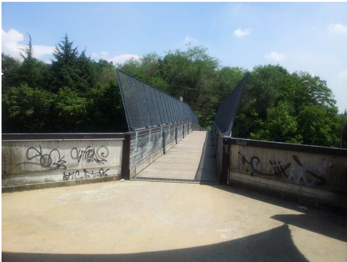
15. Vista della passerella ciclopedonale di attraversamento della Milano - Meda, collegando Parco Cava Nord con via San Michele del Carso, con le aree sportive comunali e con il centro di Paderno Dugnano