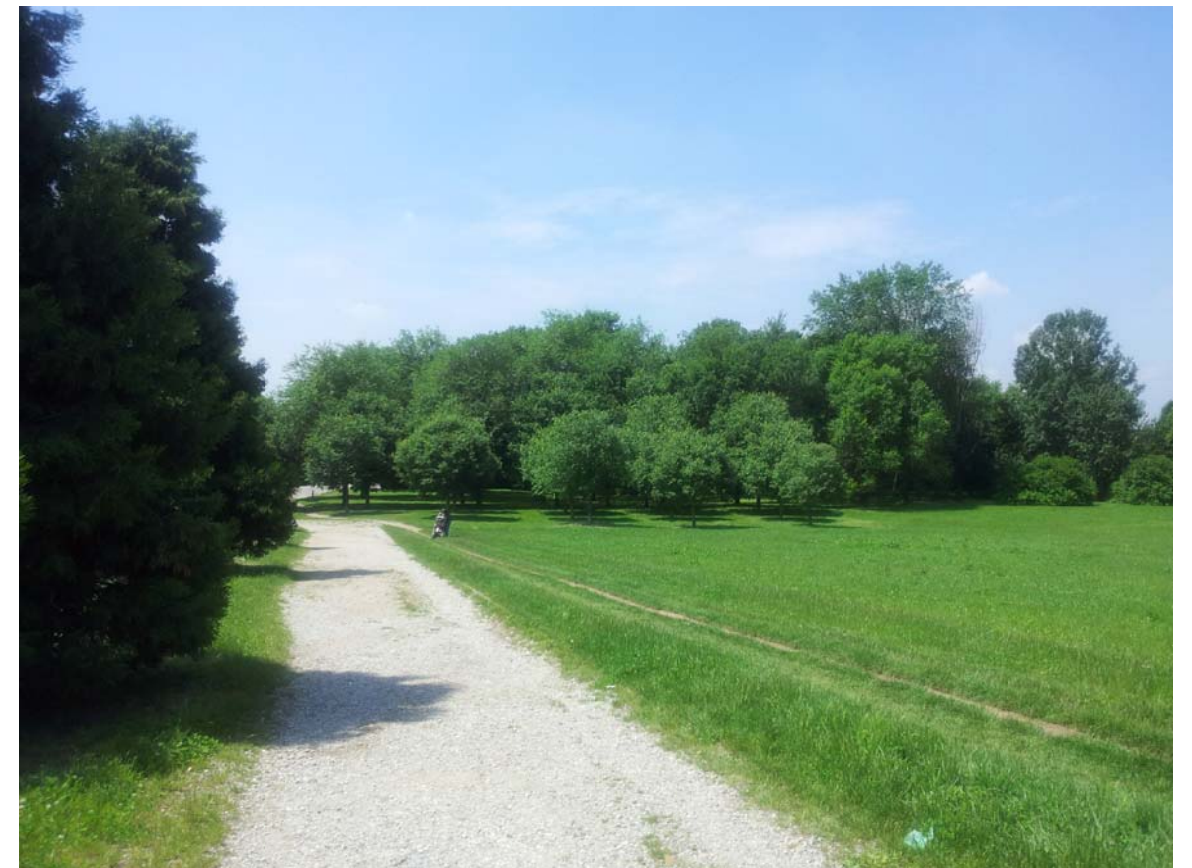
16. Porzione su terrapieno di connessione tra Parco Cava Nord e Via San Michele del Carso