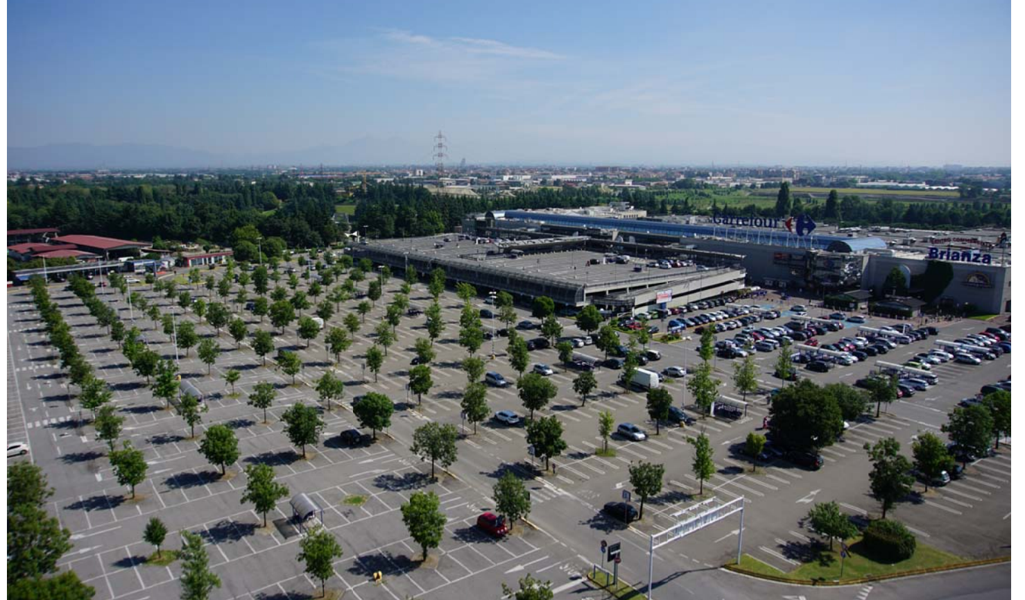
2. Vista aerea del parcheggio a raso alberato e del parcheggio multipiano