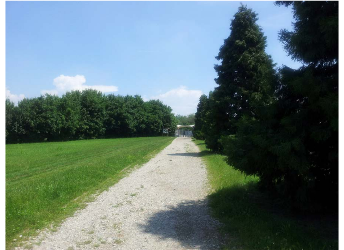
18. Porzione su terrapieno del percorso di connessione tra Parco Cava Nord e Via San Michele del Carso