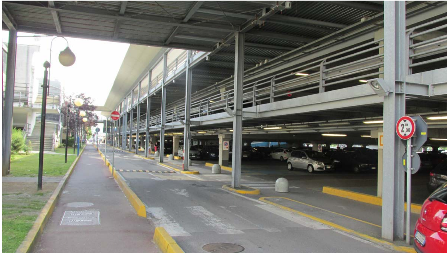
9. Vista della viabilità interna tra il fronte principale del Centro Commerciale e il silos con i collegamenti aerei alla galleria commerciale