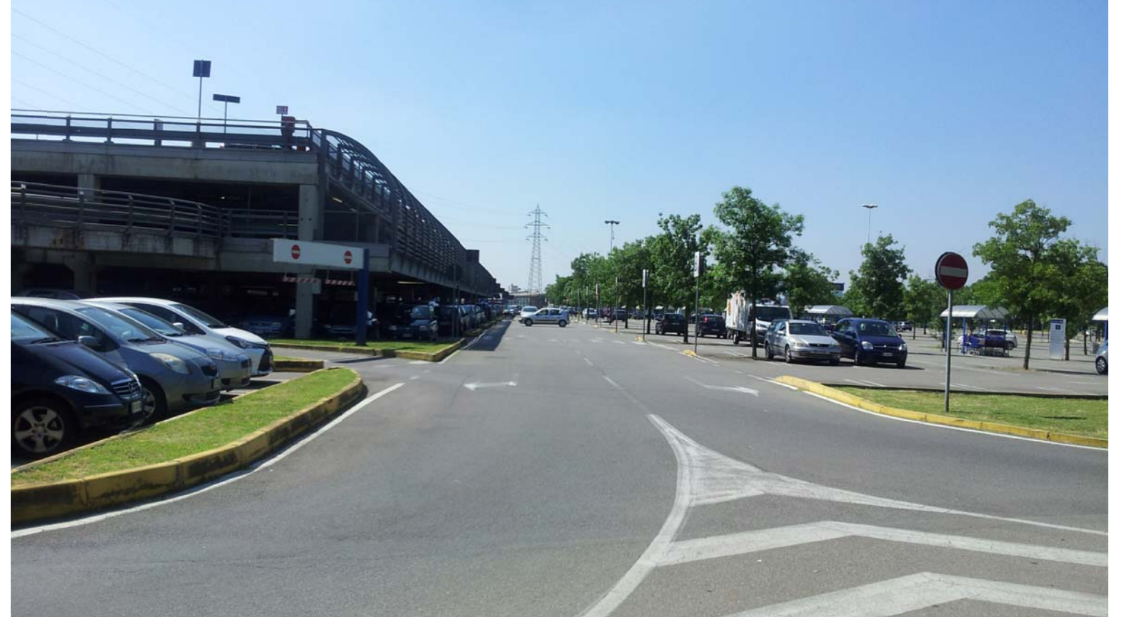
6. Dettaglio del fronte principale del silos multipiano