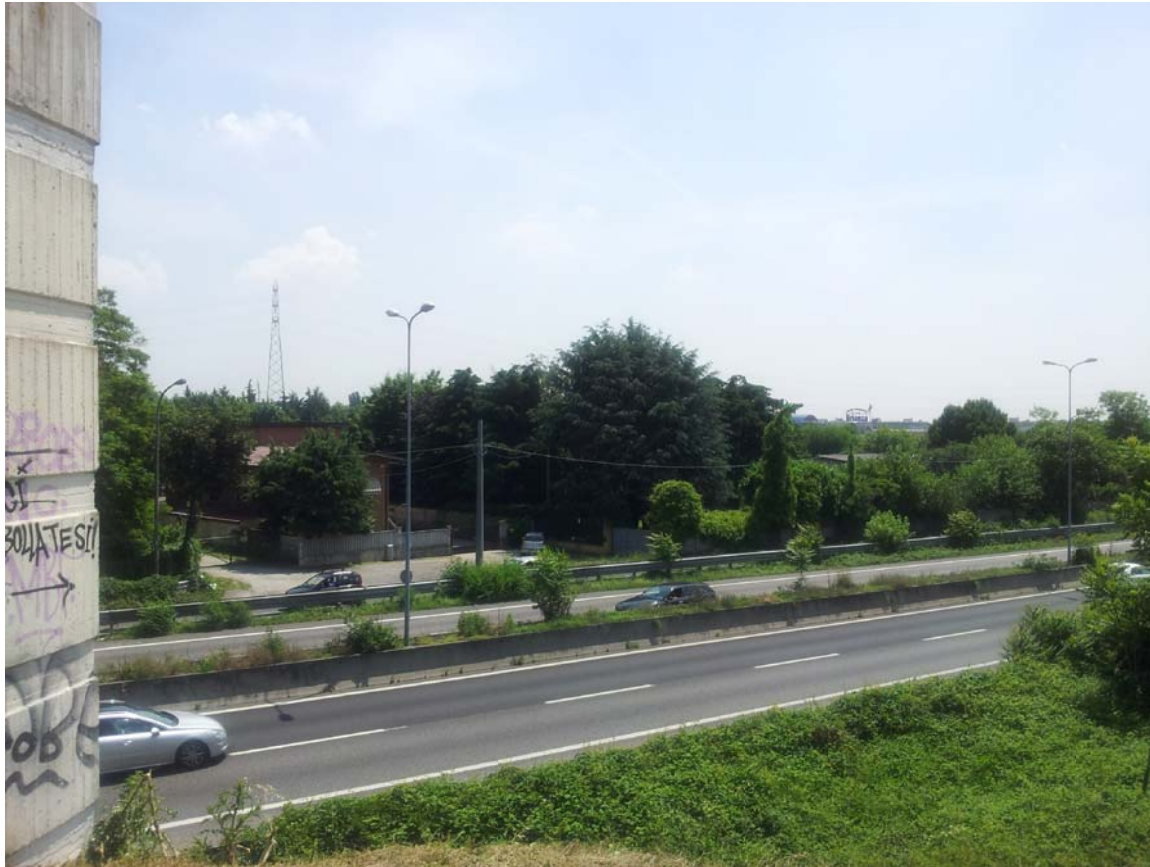
13. Vista della S.P. ex S.S. 35 Milano - Meda, dall'attacco ovest della passerella ciclopedonale