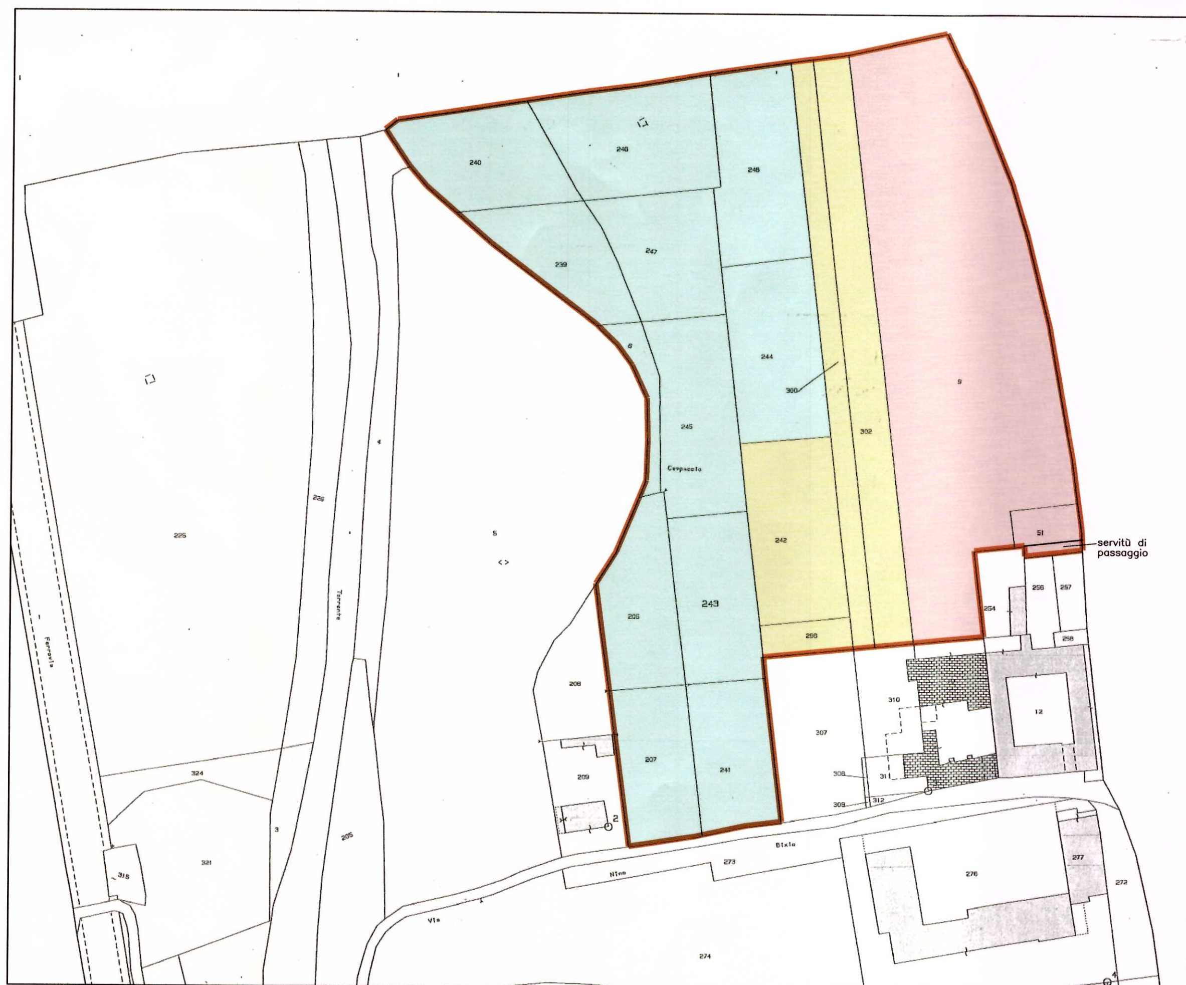
INDIVIDUAZIONE DELLE PROPRIETA' CATASTALI 1: 1000