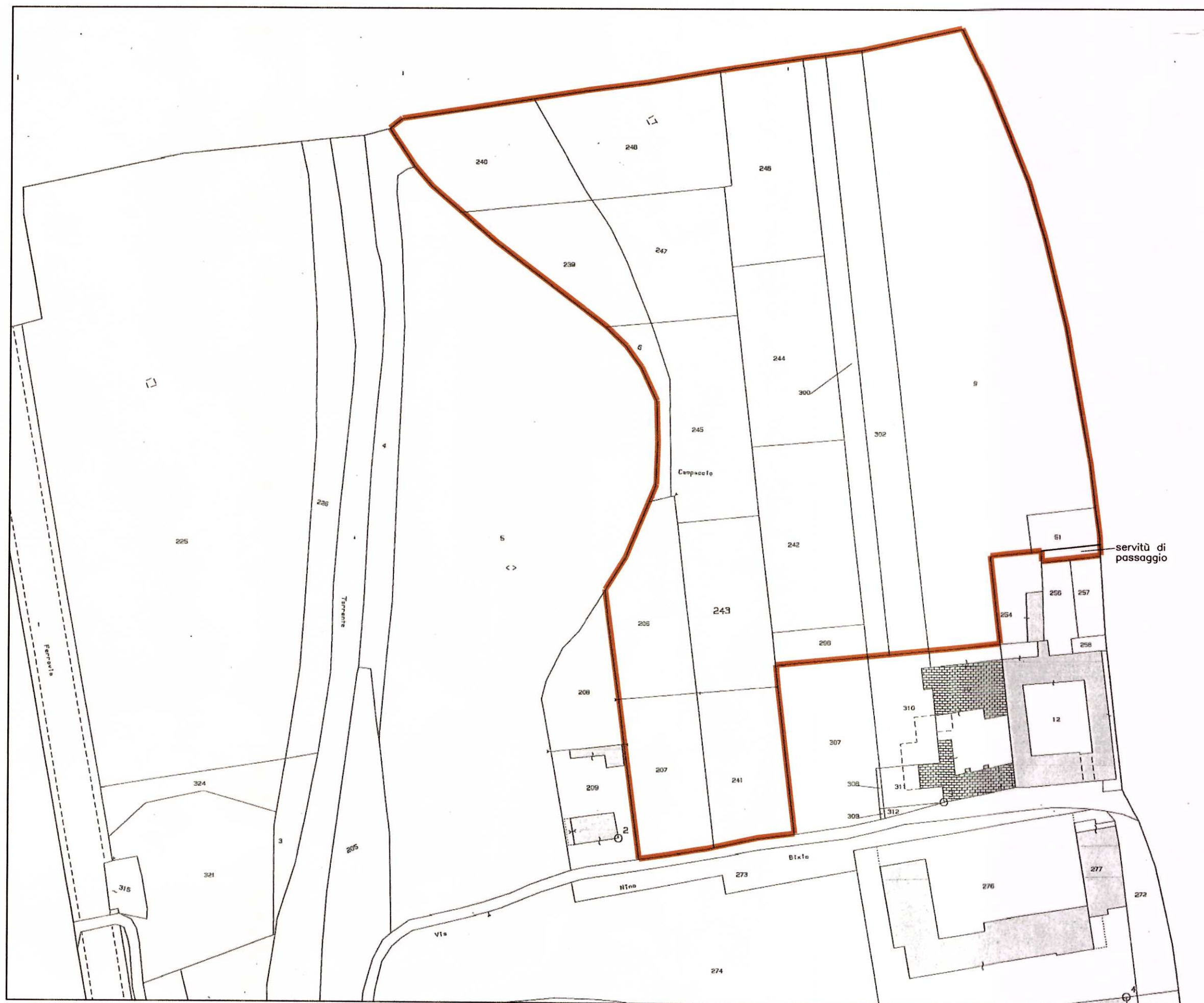
ESTRATTO MAPPA 1: 1000