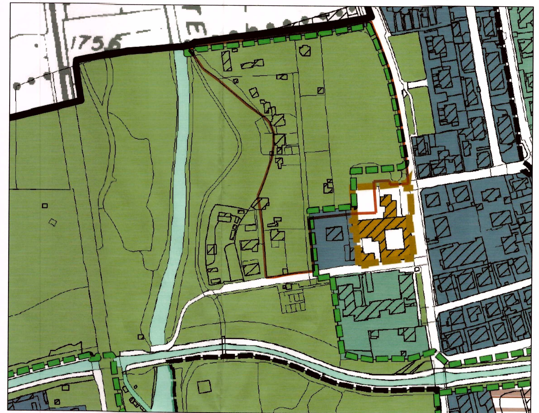
ESTRATTO P.G.T. VIGENTE