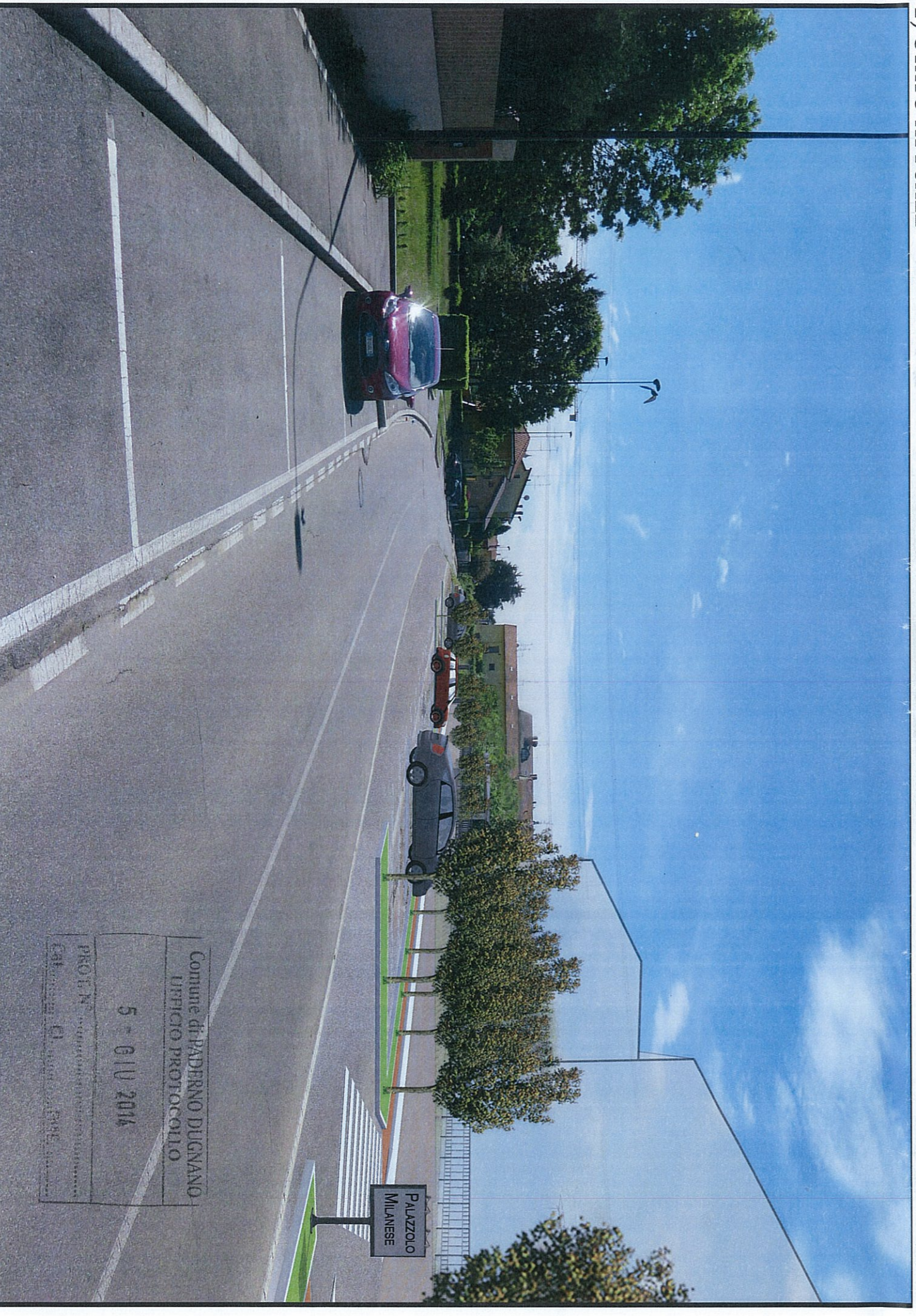
1) IN PROGETTO: OPERE UTILI A DARE CONTINUITÀ ALLA PISTA CICLABILE ESISTENTE IN CITTÀ DI VAREDO