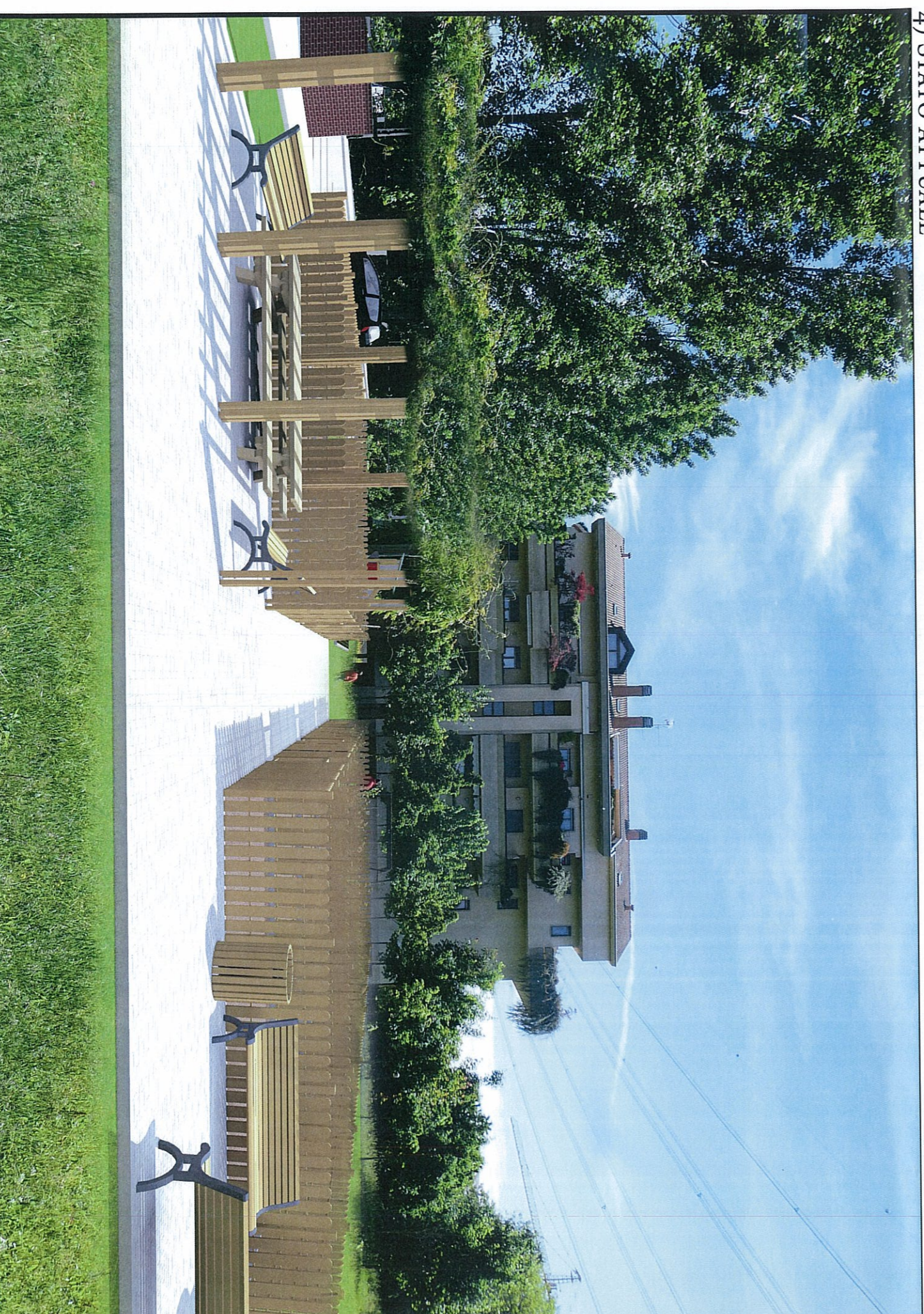
4) IN PROGETTO: RECUPERO E RIQUALIFICAZIONE DEGLI ORTI COMUNALI DI VIA NINO BIXIO