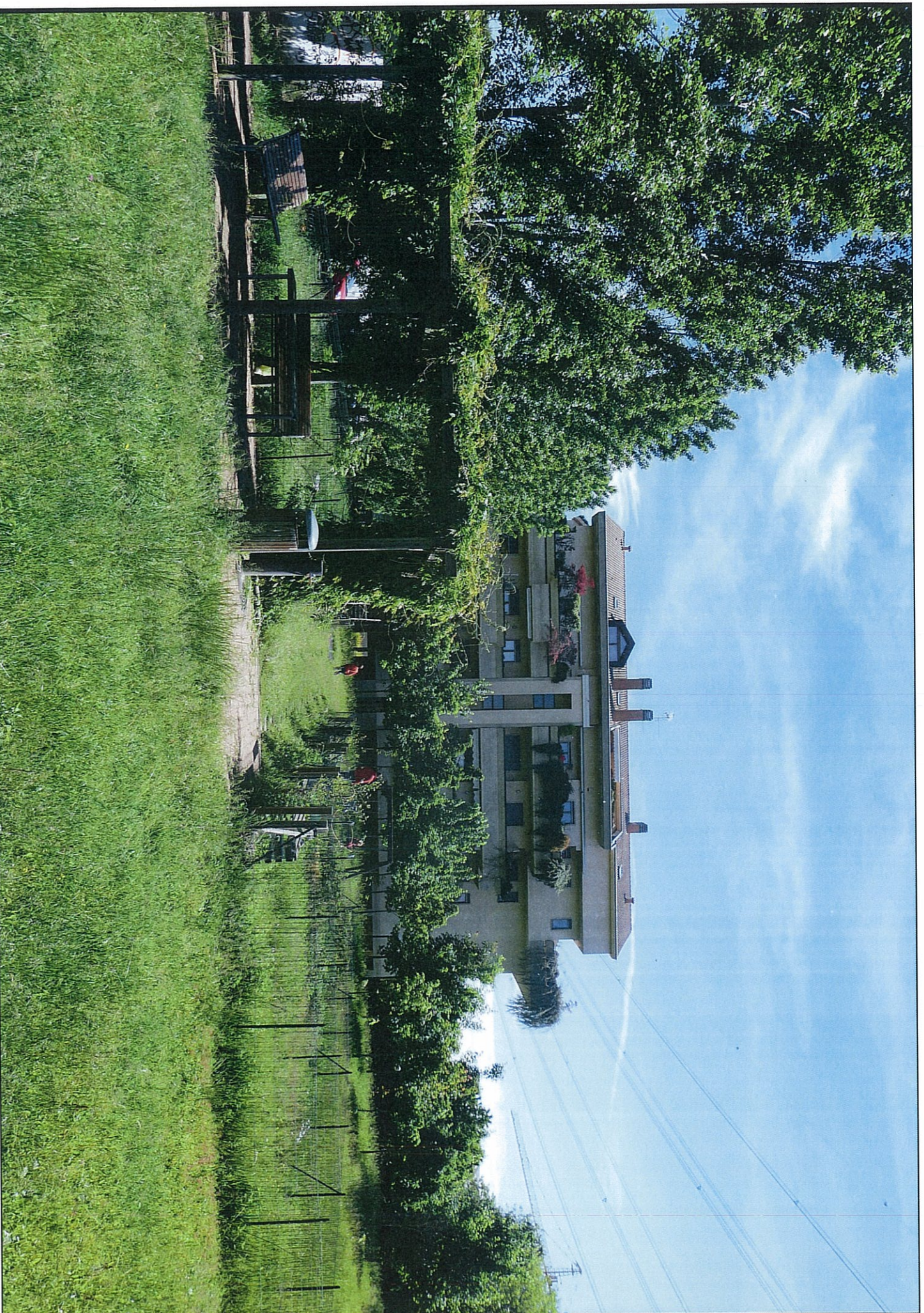
4) STATO ATTUALE