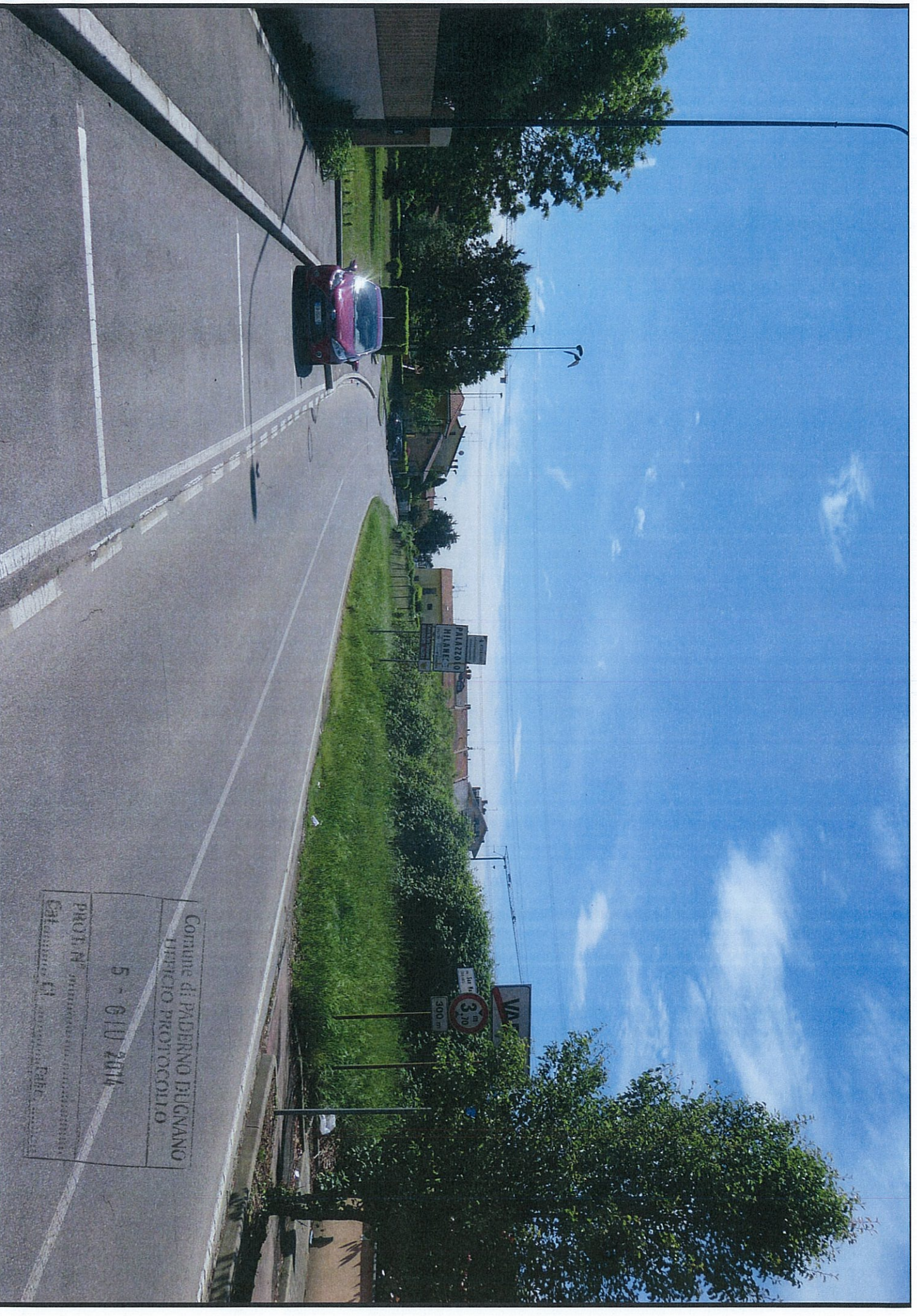
1) STATO ATTUALE