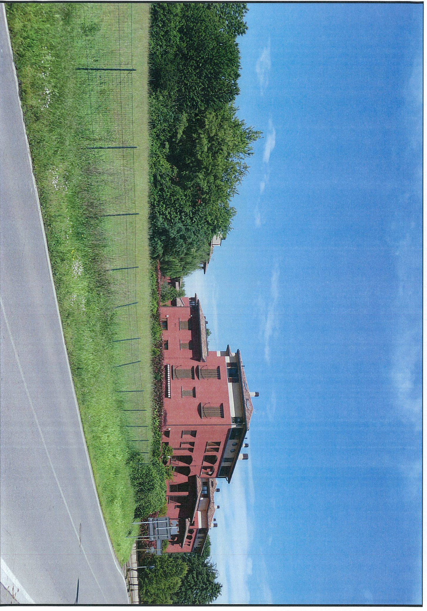
IBIS) STATO ATTUALE