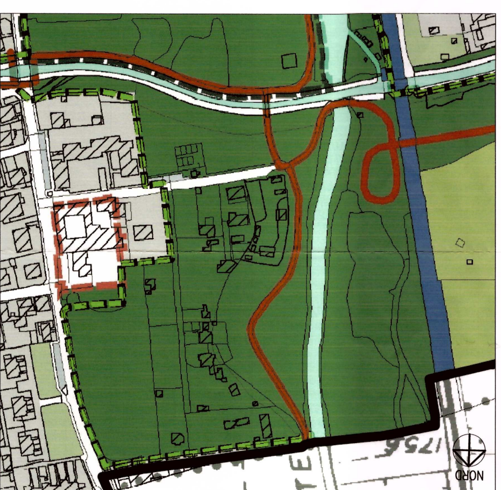
ESTRATTO DALLA TAV. PDR2 DEL P.G.I. VIGENTE (PERCORSI CICLABILI)

Beni paesaggistici individuali ai sensi dell'art. 142 lettera c del D. Lgs. n. 42/2004