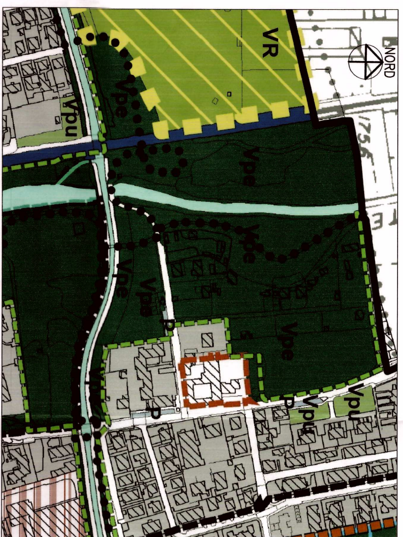
ESTRATTO DALLA TAV. PDS1 DEL P.G.I. VIGENTE (AMBITI DI APPLICAZIONE DELLA DISCIPLINA DEL PIANO DEI SERVIZI)

Servizi a verde della rete ecologica (Vpe)