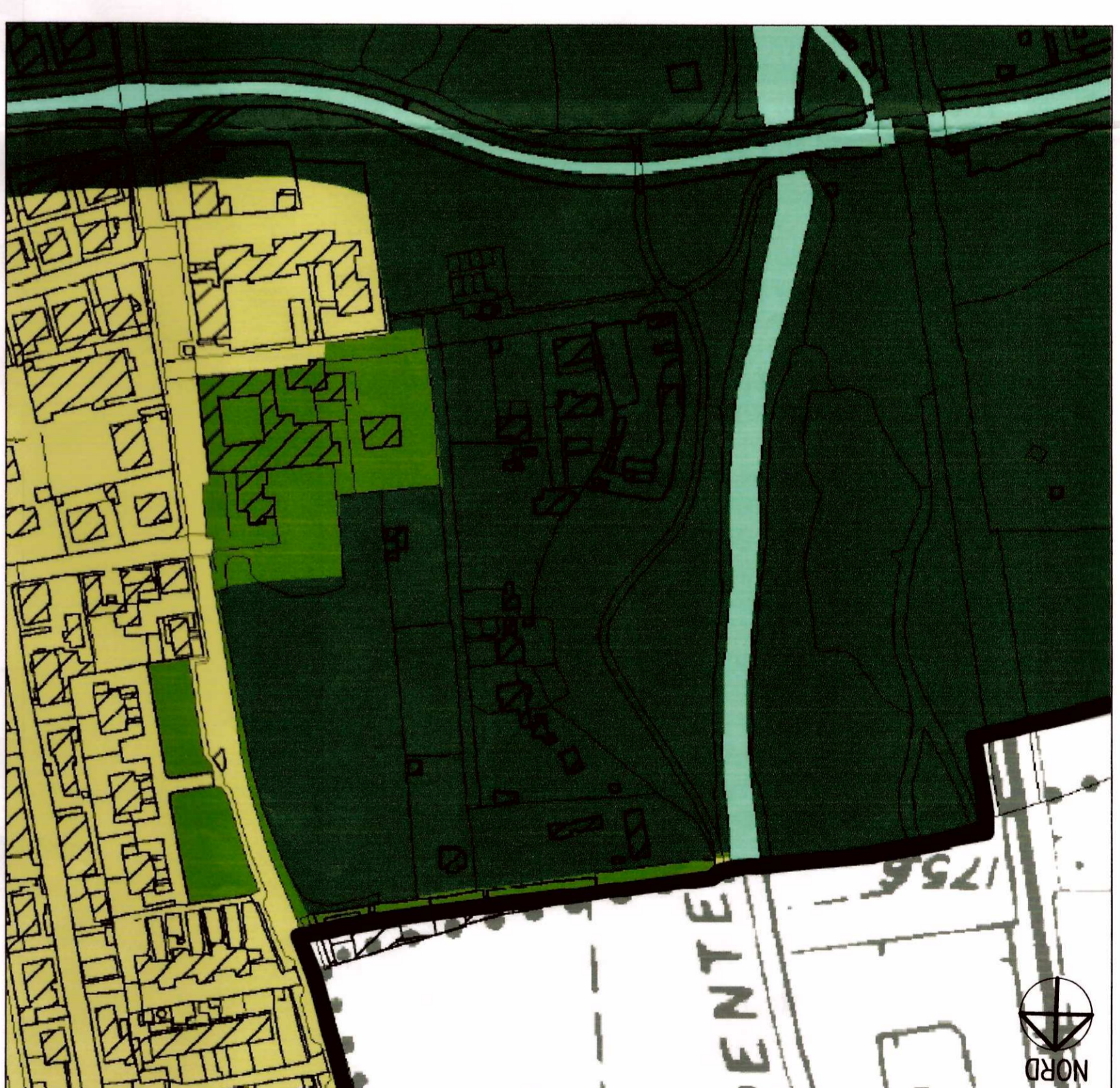
ESTRATTO DALLA TAV. PDR3 DEL P.G.I. VIGENTE (SENSIBILITÀ PAESAGGISTICA)