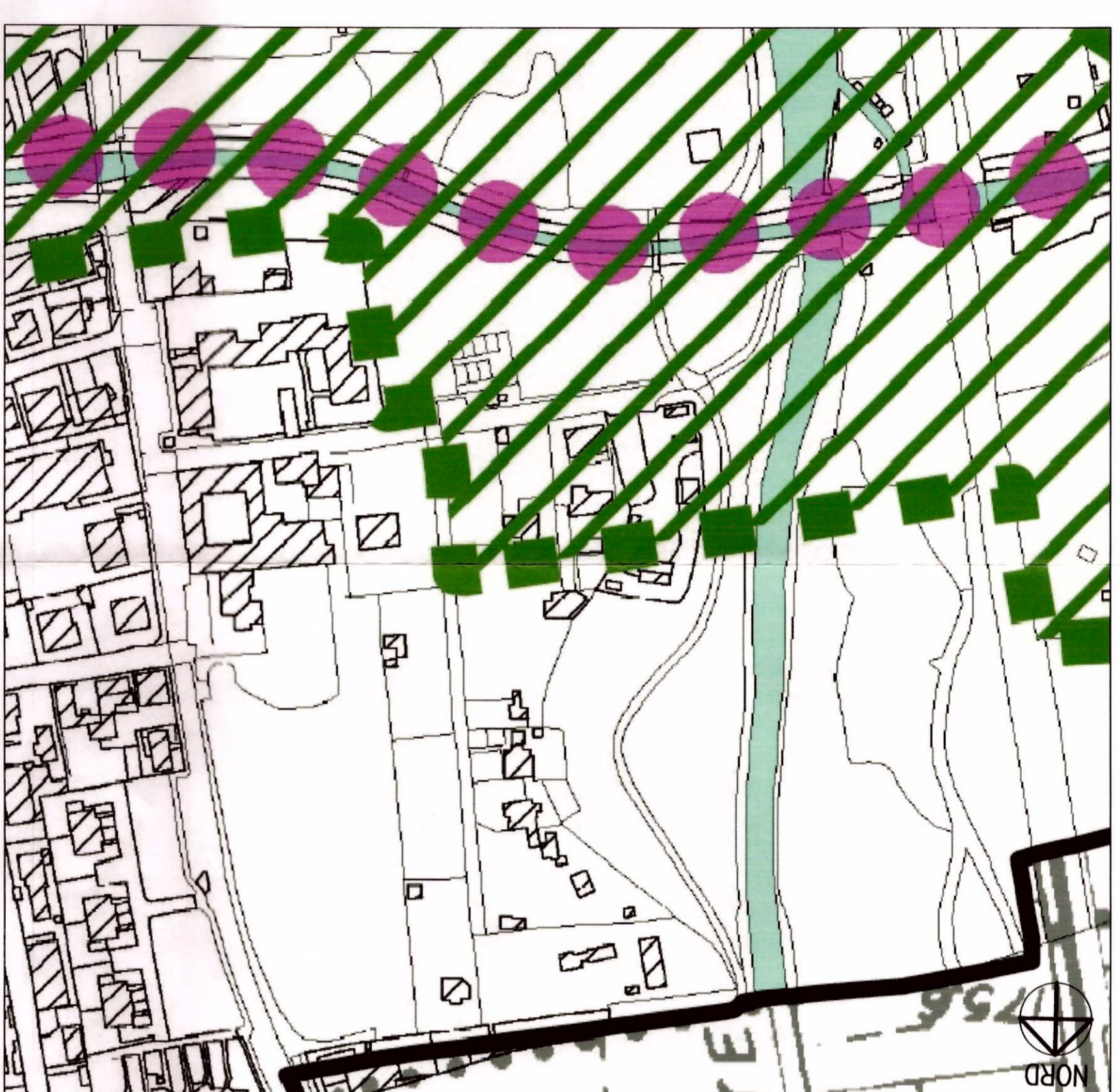
ESTRATTO DALLA TAV. PDR1b DEL P.G.I. VIGENTE (DISPOSIZIONI DI STRUMENTI SOVRARADONATI)

Servizi a verde della rete ecologica (Vpe)