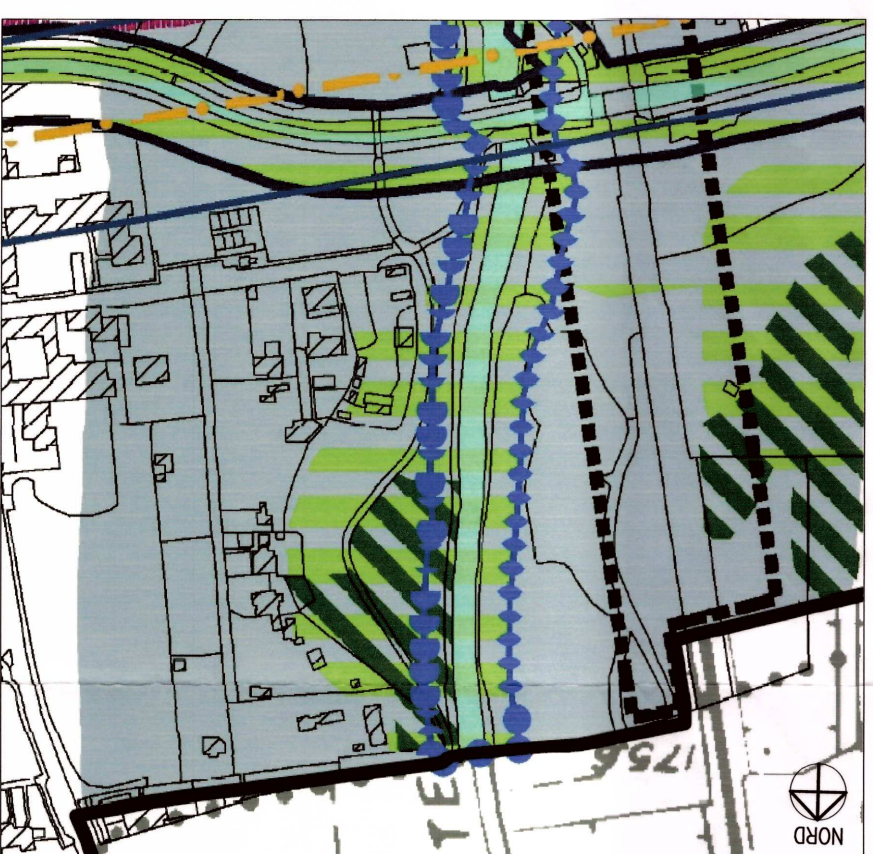
ESTRATTO DALLA TAV. PDR1a DEL P.G.I. VIGENTE (MNCOU)

Beni paesaggistici individuali ai sensi dell'art. 142 lettera c del D. Lgs. n. 42/2004