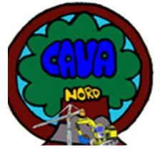
Logo vincitore 6° concorso Cava Nord 2016

tabella dati anagrafici retro del disegno