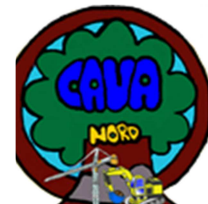
Logo vincitore 6° concorso Cava Nord 2016