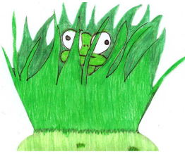
Mascotte vincitrice 2° concorso Cava Nord 2011