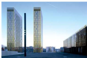
Corte di giustizia dell'UE