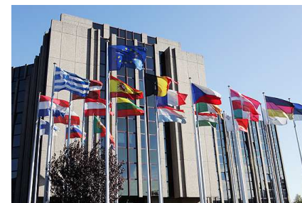
Corte dei conti europea