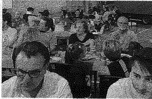
Piazzetta Lampugnani e Palazzolo e via Coti Zelati

■ Buona la prima per l'esperimento delle isole pedonali nei quartieri, a Paderno Dugnano. Mercoledì sera il primo appuntamento con le strade chiuse e i negozi aperti a Palazzolo ha portato un primo, incoraggiante riscontro per presenza di persone e famiglie in strada e ai tavolini dei bar. Si registra ad esempio una significativa risposta per la nuova apertura del locale di piazzetta Lampugnani, per il quale era in corso un cambio gestione con ristrutturazione e rilancio proprio in concomitanza con la serata del Covid. Insomma, queste aperture serali nei quartieri, saranno essenziali e fondamentali anche per tante attività che stanno tentando il lancio o il rilancio. A Palazzolo poi, il movimento serale si è concentrato in primo luogo dal passaggio a livello fino a piazza Addolorata, quindi lungo tutta via Coti Zelati, mentre via Monte Sabotino ha fatto registrare il deserto più totale. E parecchi osservatori rilevano che, nel caso in cui la dinamica in questione dovesse riproporsi anche nelle prossime settimane e nei prossimi appuntamenti, forse l'amministrazione comunale e l'assessore Paolo Mapelli potrebbero prendere in considerazione l'ipotesi di rivedere quantomeno i limiti dell'isola pedonale, per i divieti di transito. L'assessore Mapelli si dice soddisfatto di questo primo passo, e confida dopo il 14 luglio che, con il decadimento delle ultime prescrizioni di distanziamento sociale si possa avere un risultato anche più soddisfacente. «Per quanto ri-