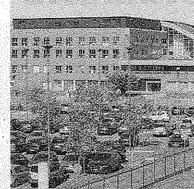
La bozza delle modifiche al traffico e la Clinica San Carlo