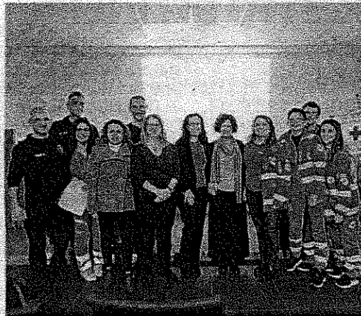
Il Calendario dell'Avvento di Tilane

famoso prodotto dolciario suonando alla porta di parenti e amici, il tutto corredato da biglietti di auguri. La famiglia "mandante" dovrà pagare un costo simbolico pari a 8 euro, che a sua volta andrà a costituire un fondo per finanziare le attività rivolte all'assistenza della popolazione, pacchi alimentari e altro. Tutti quei servizi portati avanti in questi mesi dalla Croce Rossa in favore delle famiglie che