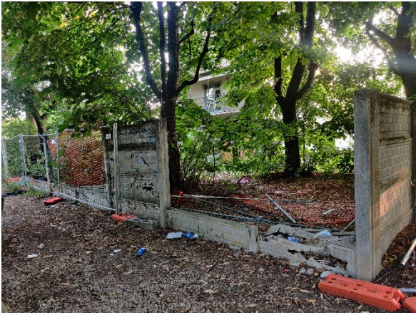
28 settembre 2023