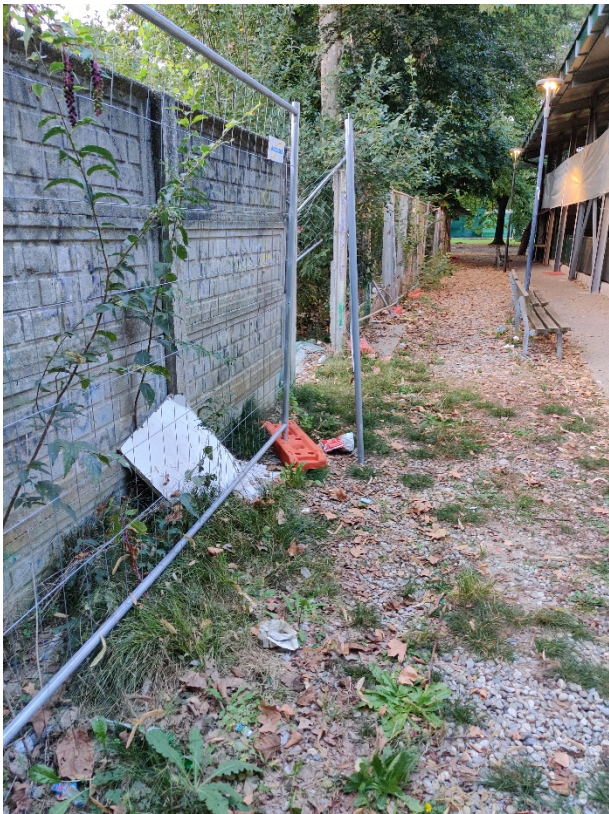
17 ottobre 2023